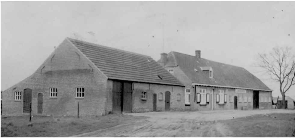
De Zwanehoeve omstreeks jaren '60