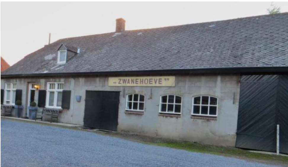
De Zwanehoeve in 2014

Reacties mogen naar e-mail stinselsarchief@outlook.com